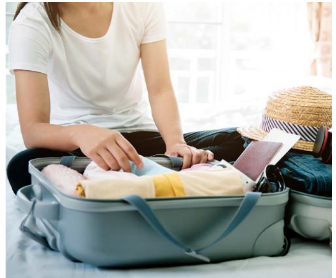
Entspannt verreisen: Am besten sprechen Sie vorher mit Ihrem Arzt.

Versicherungsschutz: Klären Sie vor einer Auslandsreise mit der Krankenversicherung, in welchen Ländern sie akzeptiert wird und wo Sie unter Umständen Vorauszahlungen leisten müssen. Informationen dazu finden Sie auf einer Internetseite der gesetzlichen Krankenkassen: www.dvka.de . Eventuell ist es sinnvoll, eine private Auslandsrankenversicherung abzuschließen, die etwa die Kosten für einen Rücktransport übernimmt. Achten Sie darauf, dass diese auch gilt, wenn die Erkrankung bei Reiseantritt schon bekannt war.