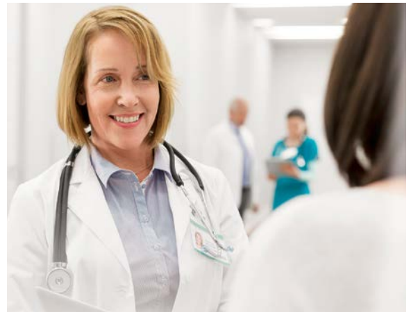
Ob eine Studie verfügbar ist und zu Ihrer Krebsform „passt“, können Frauenärztinnen und -ärzte in Brustzentren klären.

Es gibt aber auch Nachteile. So können selten bisher unbekannte Risiken einer Therapie zutage treten. Manchmal stellt sich auch heraus, dass das neue Medikament nicht besser wirkt als das alte. Aber auch ein solches Ergebnis sei wichtig, gibt die Expertin zu bedenken. „Weil es verhindert, dass weiter an Therapieansätzen geforscht wird, die Patientinnen keine Vorteile bieten und falsche Hoffnungen wecken.“